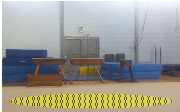
Foto 1. En el Gimnasio