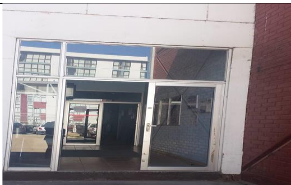
Foto 5. Mampara de vidrio entrada principal.