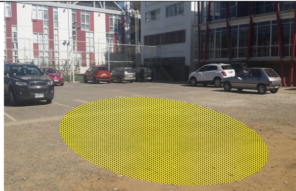
Foto 2. Estacionamiento