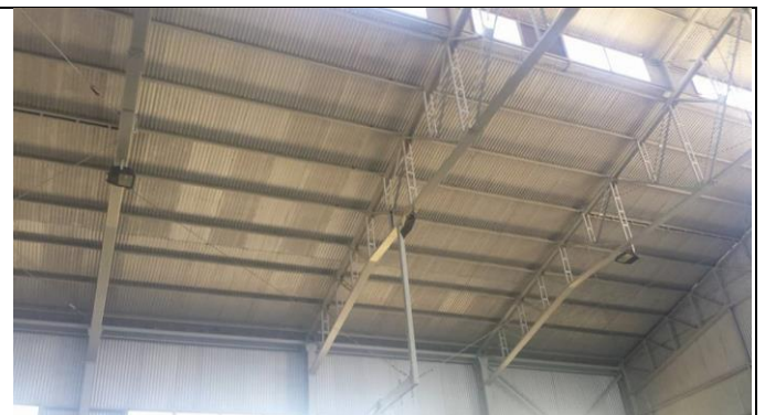
Foto 6. Focos dentro del gimnasio