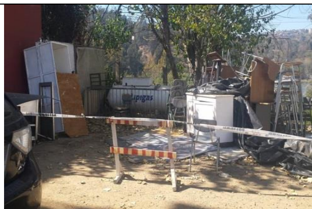
Foto 3. Estanque de gas